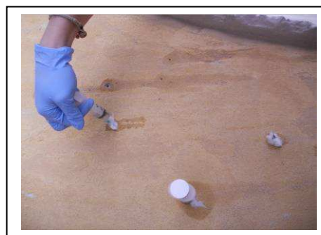
Foto 1 e 2: riadesione intonaco storico alla muratura ed iniezioni di saturazione delle porzioni di distacco

L'uso del prodotto implica la verifica della sua idoneità all'impiego previsto e l'assunzione delle responsabilità derivanti dall'utilizzo. I dati riportati sono ottenuti da misure di laboratorio. La HD SYSTEM s.r.l. si riserva di apportare in qualsiasi momento e senza preavviso le varianti ritenute più opportune ai dati tecnici riportati.