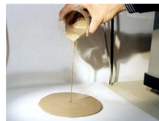
Particolare consistenza impasto

L'uso del prodotto implica la verifica della sua idoneità all'impiego previsto e l'assunzione delle responsabilità derivanti dall'utilizzo. I dati riportati sono ottenuti da misure di laboratorio. La HD SYSTEM s.r.l. si riserva di apportare in qualsiasi momento e senza preavviso le varianti ritenute più opportune ai dati tecnici riportati.